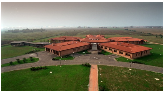
Hospice Bentivoglio 30 posti letto - 2001

Le aree di intervento riguardano l'assistenza, residenziale ed ambulatoriale, la formazione dei professionisti, la ricerca scientifica e la divulgazione.