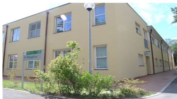
Hospice Casalecchio 15 posti letto - 2012